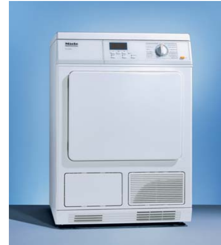
상업용 의류건조기 PT 5135C

• PT 7135C PLUS · 기본 프로그램 : 면(건조 7단계), 최소건조건조 3단계) · 선택사항 : 저온건조→ 매우 민감한 옷에 대해 부드럽게 건조시킴 · 예약건조 : 온풍, 냉풍 · 특별 프로그램 : 수건, 주름방지, 울 손세탁, 방수, 데님, 셔츠, 아웃도어웨어