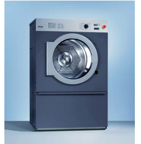
상업용 의류건조기 T 6251

환풍형 건조방식 가열 방식 : 전기, 가스 용량 : 32kg 자주 사용하는 프로그램 저장 종료시 쿨다운 기능 응급 멈춤 버튼 잔존 수분 감지센서 단축버튼 사용