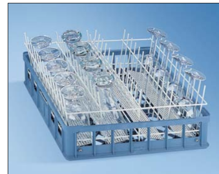
U 317 바스켓