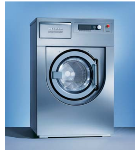
상업용 세탁기 PW 6101

조작방식 : Prdtronic M 중량감지 센서에 의한 세탁량 자동인식 세탁물 불균형 감지 센서 Schock absorber 장착 용량 : 10kg 최대탈수속도 : 1200rpm 자주 사용하는 프로그램 저장 기능 크롬도어 스테인레스 외장 행굼물 재활용 시스템(선택사항) 허니컴 드럼 단추버튼 사용가능 응급 멈춤 버튼 도어 안전 시스템 G-factor : 475