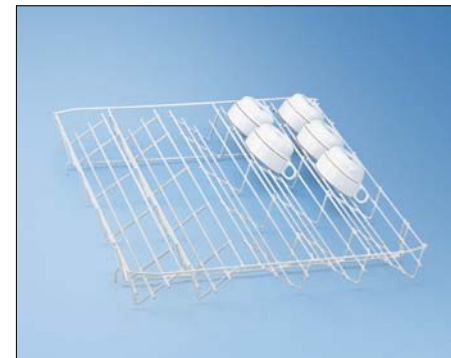
E 809 인서트 1/1