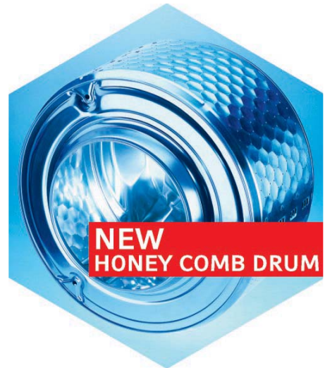
NEW HONEY COMB DRUM