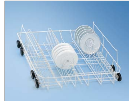
U 881 하단바스켓