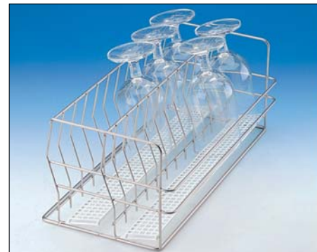
E 459 인서트 1/2