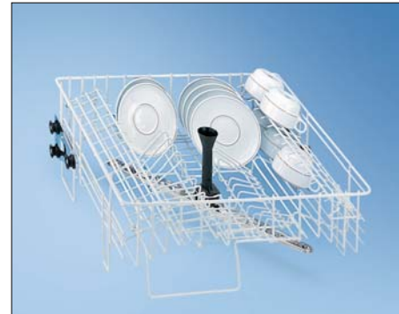
O 881 상단바스켓