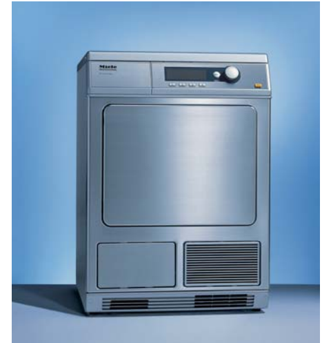
상업용 의류건조기 PT 7135C PLUS

성능 · 용량: 9kg · 남은시간 표시기능 · 드럼 내부 조명 · 잔존수분 감지센서 · 허니컴 드럼 · 주름방지 기능 · 견고하고 강한 내구성 · 예약 시작 · 좌우, 전면 판넬 분리가능(A/S 편리) · 코인장치 기능(선택사항) · 잔존수분감지 센서 · 세탁기와 2단 적재가능