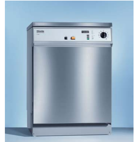
상업용 식기세척기 G 7856

정격 소비전력 : 5.8kW 순환펌프 : 0.43kW 차단기용량 : 6.4kW