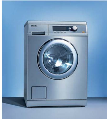
PW 6065 PLUS

특징 · 24시간 예약기능 · 남은 시간 표시기능 · 주파수 제어 가능한 FC 모터 · 허니컴 드럼 · 불균형 감지센서 · 좌우, 전면 판넬 분리가능(A/S 편리) · 강한 내구성 · 견고하고 세련된 도어(크롬 도금) · 뛰어난 탈수력으로 건조 시 에너지 절감 · 섬세한 세탁리듬으로 옷감 손상 거의 없음 · 액체세제 사용 장치(선택사항) · 코인장치 설치가능(선택사항) · 냉, 온수 연결가능 · 의류건조기와 2단 적재가능