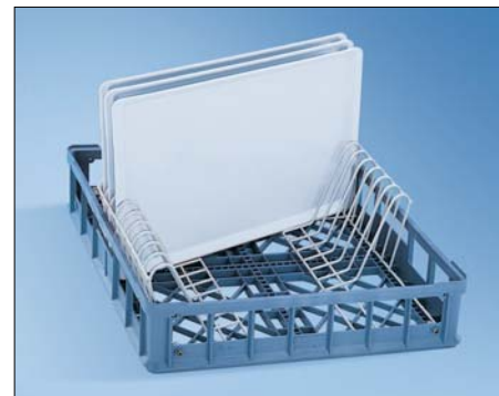
U 313/1 바스켓