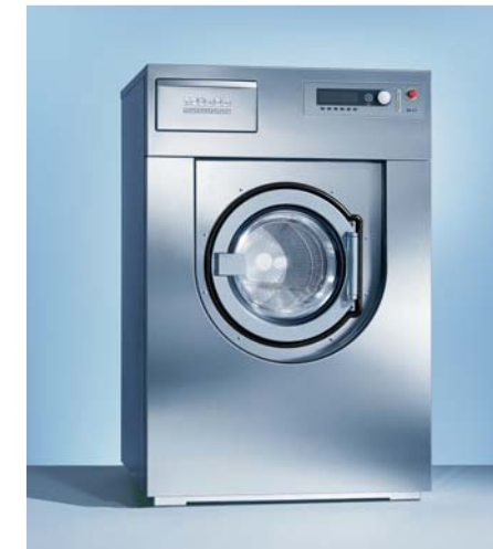
상업용 세탁기 PW 6161

조작방식 : Prdtronic M 중량감지 센서에 의한 세탁량 자동인식 세탁물 불균형 감지 센서 Schock absorber 장착 용량 : 10kg 최대탈수속도 : 1200rpm 자주 사용하는 프로그램 저장 기능 크롬도어 스테인레스 외장 행굼물 재활용 시스템(선택사항) 허니컴 드럼 단추버튼 사용가능 응급 멈춤 버튼 도어 안전 시스템 G-factor : 475