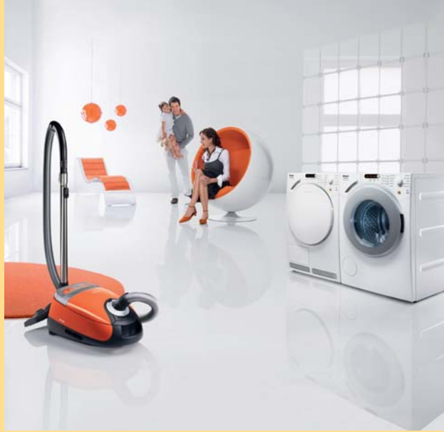
다양한 밀레 프리미엄 가전 제품군들