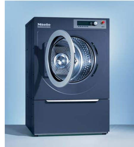
상업용 의류건조기 PT 7251

T모델 프로그램조절방식 : Troctronic 기본세탁프로그램 추가건조, 기계다림질(3단계), 일반(플러스), 손다림질