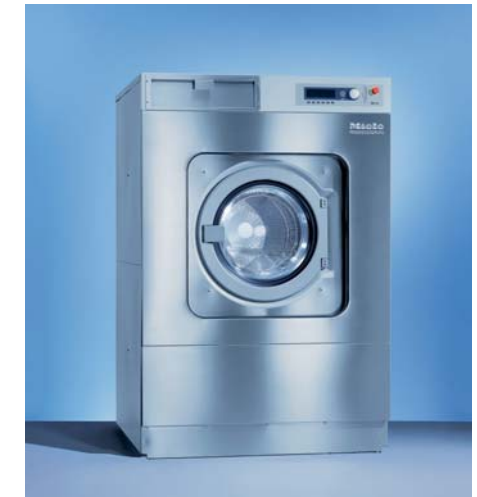
상업용 세탁기 PW 6241

조작방식 : Prdtronic M 중량감지 센서에 의한 세탁량 자동인식 세탁물 불균형 감지 센서 Schock absorber 장착 용량 : 16kg 최대탈수속도 : 1100rpm 자주 사용하는 프로그램 저장 기능 크롬도어 스테인레스 외장 행굼물 재활용 시스템(선택사항) 허니컴 드럼 단추버튼 사용가능 응급 멈춤 버튼 도어 안전 시스템 G-factor : 500