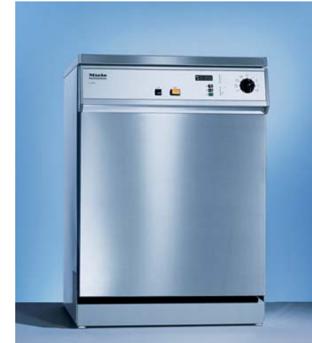
상업용 식기세척기 G 7855

용량 상단바스켓: 수저 238개 하단바스켓: 접시 164개, 수저 518개